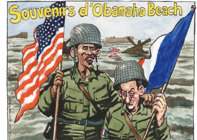
Nicolas Sarkozy et Barack Obama, 2009