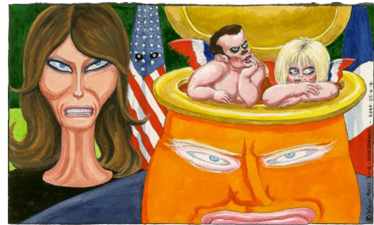
Emmanuel et Brigitte Macron, Donald et Melania Trump, 2018