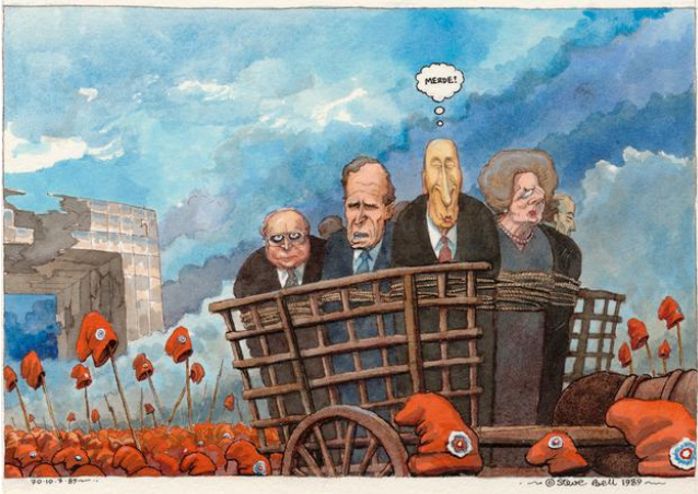
François Mitterrand en compagnie de George Bush, Helmut Kohl et Margaret Thatcher, 1989